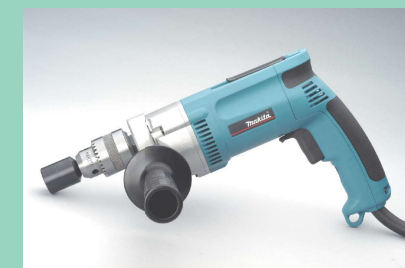
パワーユニット マキタ電気ドリル DP4002