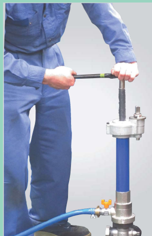
専用ラチェットハンドル(オプション)を使用すれば、手動でも穿孔できます。(左回転での穿孔になります)