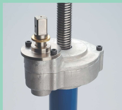
クラッチシャフトの上下で穿孔と早送りをすばやく切り替え

サドル付分水栓との取付けねじの緩みを防ぐことで、本体が振り回されることがありません。