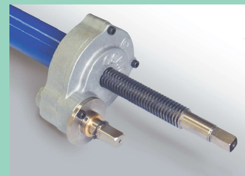
スピンドル自動送りの採用により、どなたでも簡単に操作できます