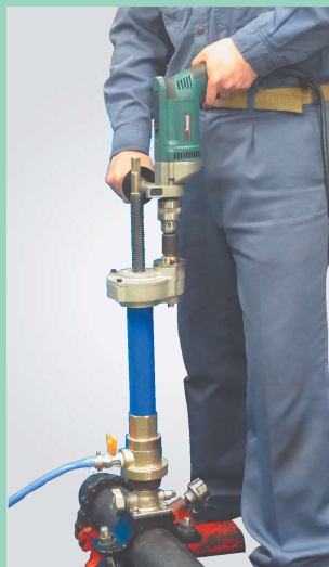
穿孔中はパワーユニットを支えるだけの簡単さ