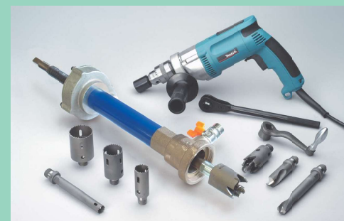
必要に応じて、セット内容を選べるフルチョイスシステムを採用